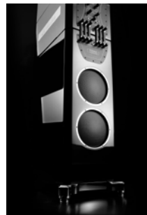
Das Thema HiFi fand er spannend, das Umfeld eher frustrierend. | He found the topic of hi-fi exciting, but found the industry frustrating.

Die ersten vier Jahre in Leipzig waren, wie es Janczak formuliert, „harte Aufbauarbeit“. Nach dem