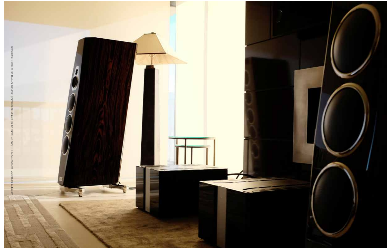
lizenziert für / licensed for: TIDAL Audio GmbH | Immedorfer Straße 1 | 50354 Hürth | Germany | T +49 2233 9669225 | www.tidal.audio.com